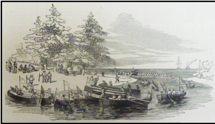
Gambar 4: "The Expedition Crossing the Bar of the River at Tunku." (Ekspedisi menyeberang benteng sungai di Kampung Tunku)