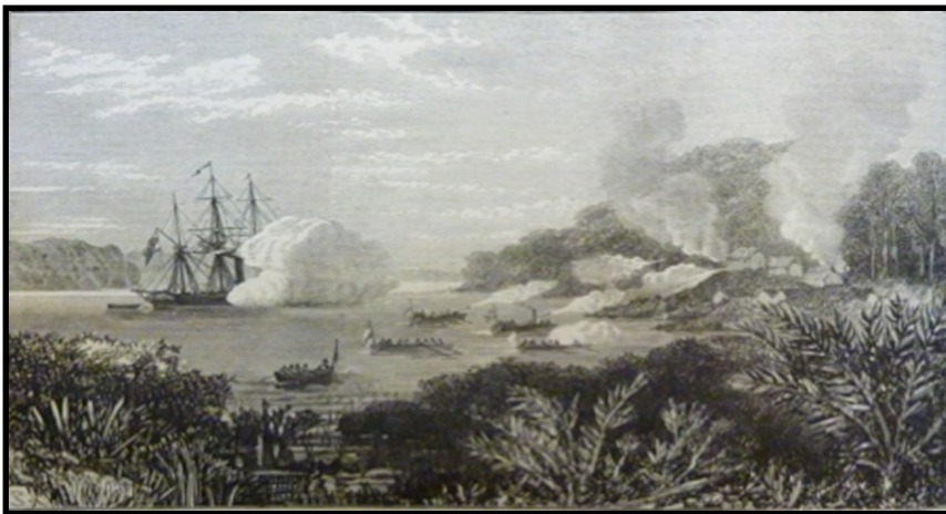
Gambar 7: “Destruction of A Pirates’ Stronghold By H.M.S. Nassau” (Pemusnahan Kubu kuat Lanun oleh angkatan HMS Nassau)