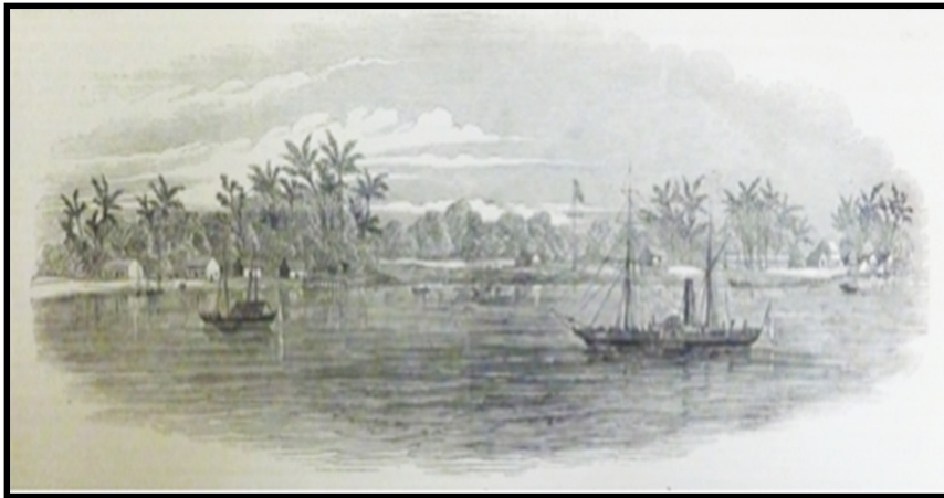
Gambar 2: "View In The New Colony of Labuan" (Pemandangan Wilayah baru Labuan)