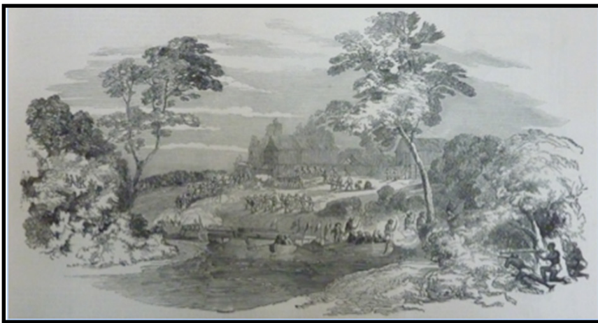
Gambar 5: "The Attack" (Serangan)