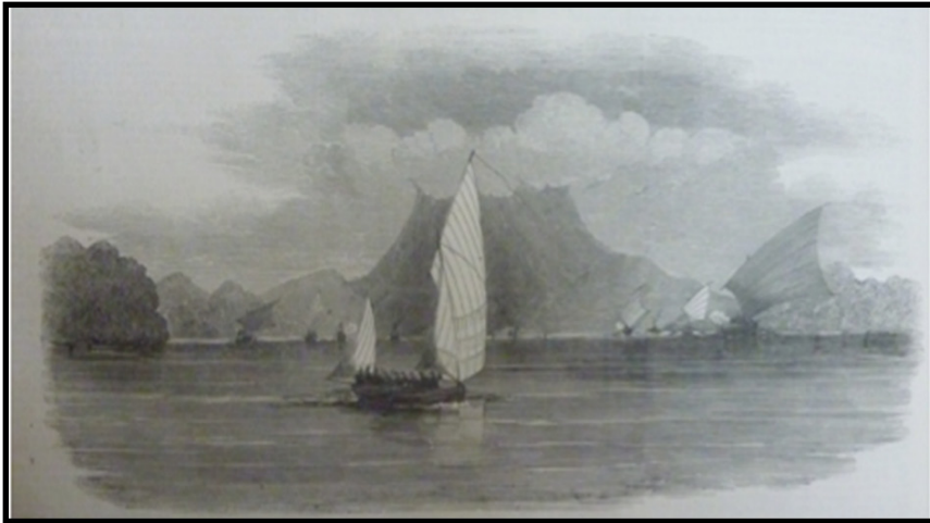
Gambar 3: "Fleet of Malay Pirates and "Royalist" boat in Endeavour Straits".